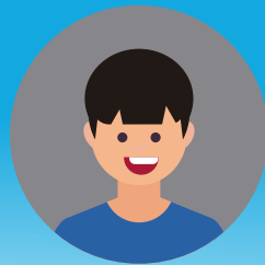
tus tub puv hnuv nyooq 20 xyoo