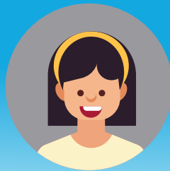
tus txhais puv hnuv nyooq 18 xyoo

NIAM TXIV TSIS TAU LAM CIA ME NYUAM SIB YUAV UA NTEJ THAUM